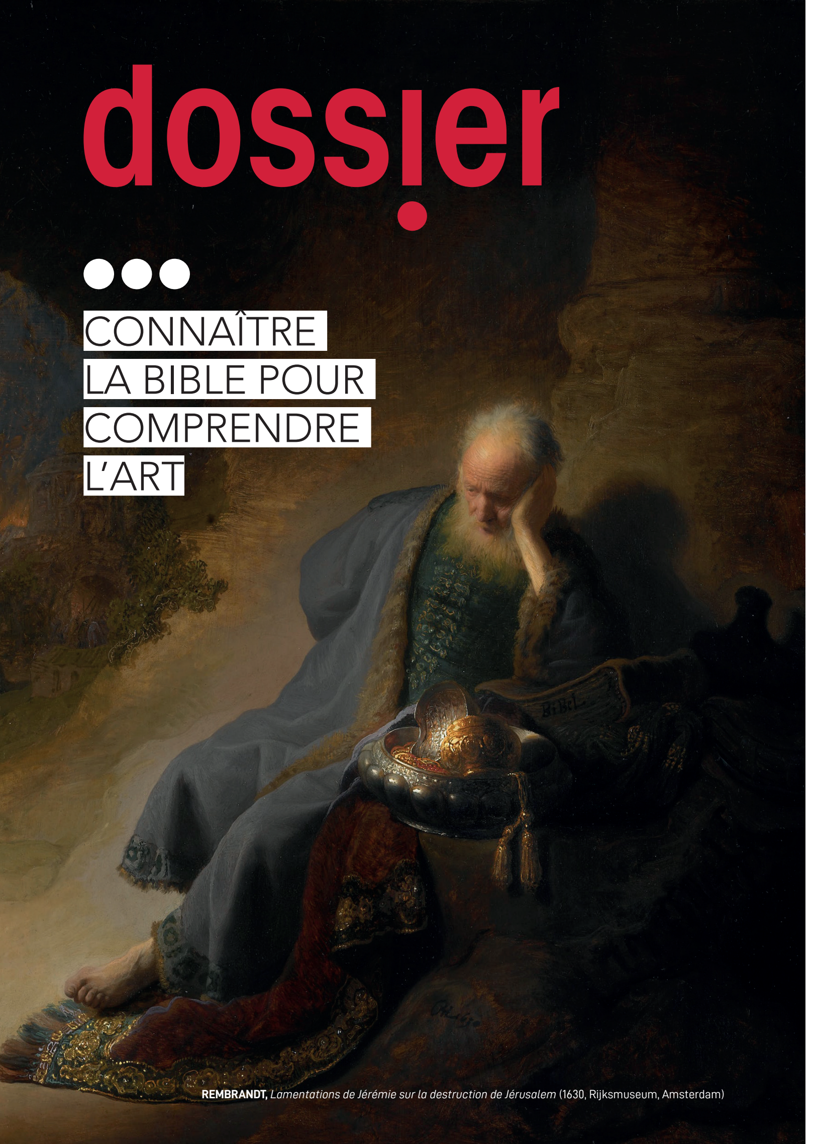
REMBRANDT, Lamentations de Jérémie sur la destruction de Jérusalem (1630, Rijksmuseum, Amsterdam)

CONNAÎTRE LA BIBLE POUR COMPRENDRE L'ART